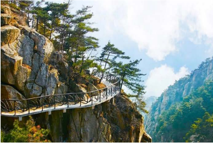
蒙山龜蒙景區-江北第一棧道