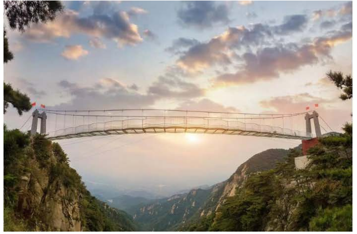
蒙山龜蒙景區-玻璃橋