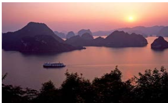
世界遺產～下龍灣 Halong bay