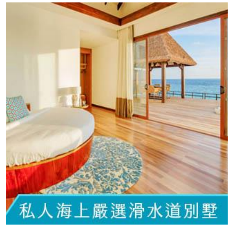
私人海上嚴選滑水道別墅