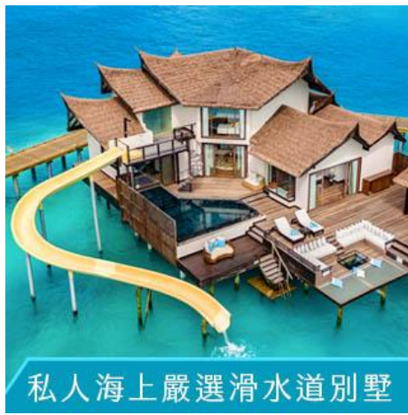
私人海上嚴選滑水道別墅